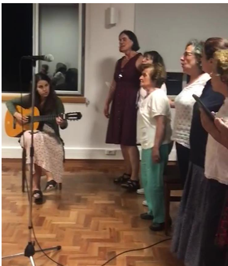
Participantes en el encuentro

La casa de la compasión y la alegría (la fisonomía de una Iglesia vulnerable).