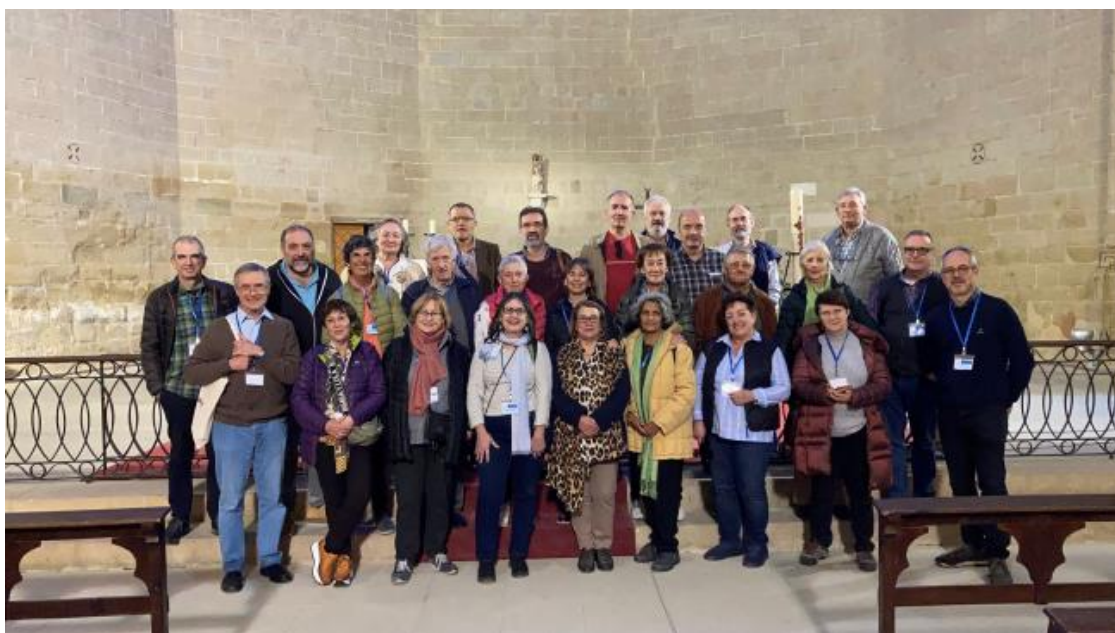
Participantes en el encuentro

A continuación, publicamos una serie de reseñas sobre el encuentro realizadas por participantes en el mismo.