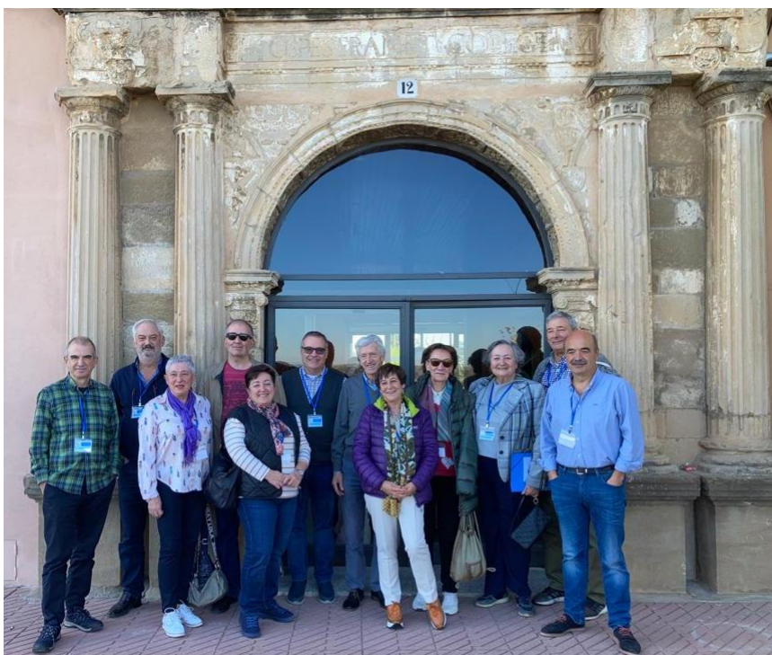
Participantes de Solasbide y BKA

La muerte como referente ineludible del sentido profundo y revalorizador de la Vida nos ayudó a hablar del Tránsito y sus incertidumbres con toda naturalidad y esperanza. Esa esperanza serena que él reclamaba para los creyentes, a pesar de que racionalmente sea difícil de justificar y verbalmente difícil de comunicar.