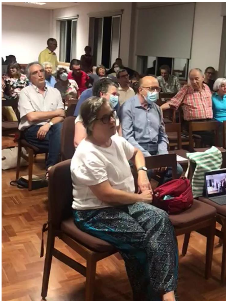
Participantes en el encuentro

cooperar en los urgentes cambios que el planeta y la sociedad nos desafían a realizar.