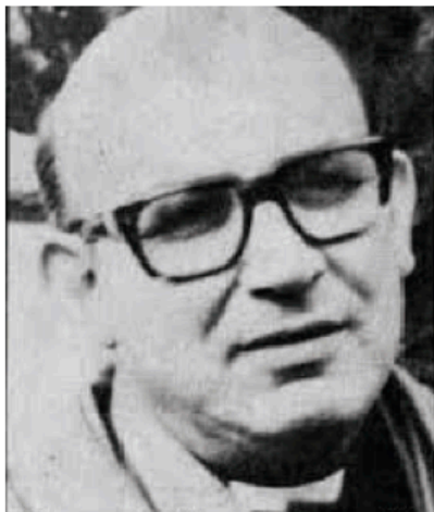
Con un oído en el pueblo y otro en el Evangelio

(...) Nuestra responsabilidad de votar no se acaba en las urnas ni en haber conseguido que 'mi candidato' y 'mi partido' salga triunfante. Hecha la opción por un determinado partido y por determinados candidatos comienza la gran responsabilidad de asumir una actitud crítica, constructiva pero clara, y muchas veces valiente, cuando quienes asumen la grave y difícil responsabilidad de gobernar, dejan de ser servidores del crecimiento integral del pueblo y usan el poder para conseguir intereses personales o de grupos privilegiados. El voto da la capacidad, el derecho y la obligación de ser VIGÍAS Y COSTUARIOS, para que el gran protagonista, que es el pueblo, no sea 'marginado'. VOTAR, por tanto, exige asumir una gran responsabilidad ante la propia conciencia, ante la comunidad y ante la historia. (...)