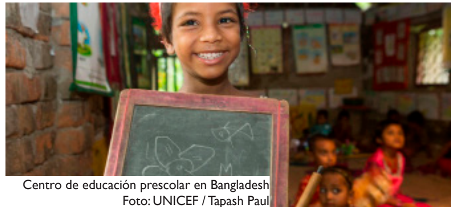
Centro de educación preescolar en Bangladesh

Sin embargo, para muchos, a pesar de las difíciles condiciones internas, la alternativa fuera es peor. Desde