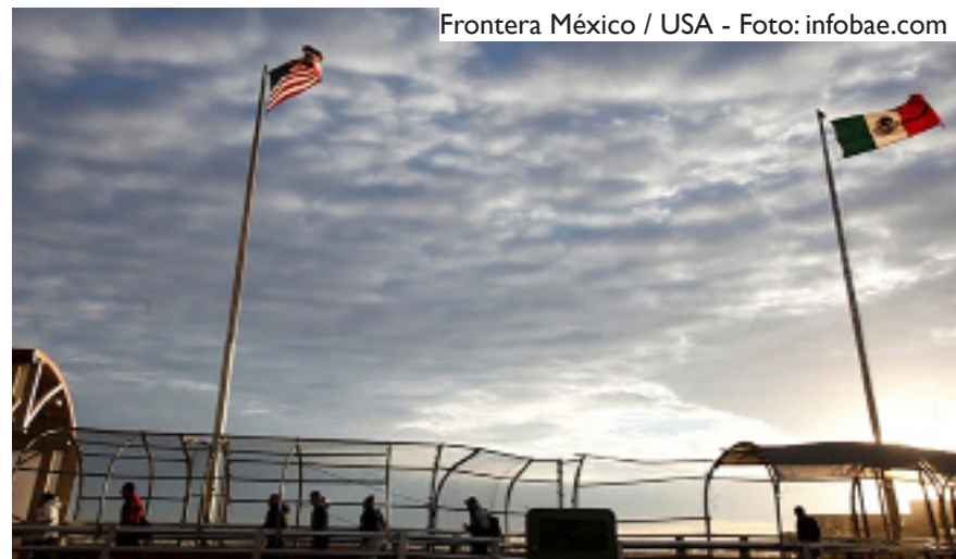
Frontera México / USA

debemos observar lo que está sucediendo en sus países de origen. No tiene sentido cortar la ayuda a los países centroamericanos cuando las personas necesitan ayuda desesperadamente; ahora es el momento de reunir las mejores mentes de la región (desde Canadá, Estados Unidos, México, Guatemala, El Salvador, Honduras y otros lugares) para analizar la situación y buscar formas creativas de salvar vidas. No podemos confiar en los gobiernos para resolver este problema; las asociaciones civiles, las organizaciones no gubernamentales y las comunidades religiosas deben participar en este diálogo. Además, el