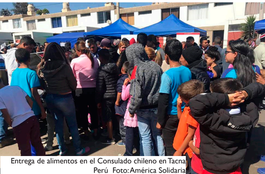
Entrega de alimentos en el Consulado chileno en Tacna Perú

Mientras el éxodo venezolano perdure, urge una respuesta coordinada y flexible a la emergencia social