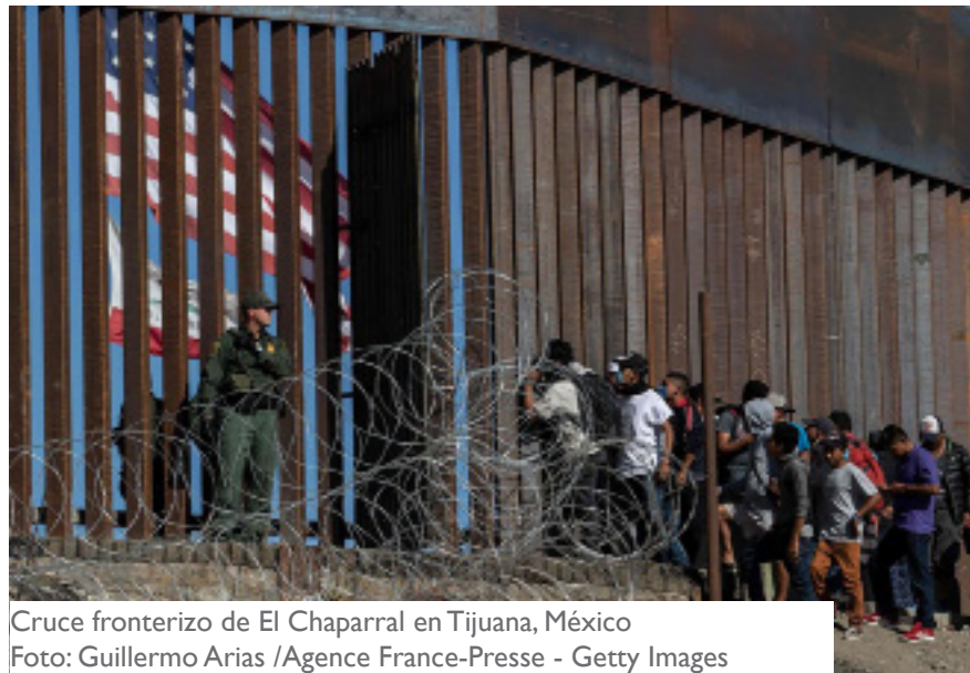
Cruce fronterizo de El Chaparral en Tijuana, México

A l reflexionar sobre todo lo que ha estado sucediendo en la frontera entre los Estados Unidos y México durante los últimos 10 meses, se me ocurre que hay un elefante en la habitación del que nadie se atreve a hablar. Aunque es impopular decirlo, es demasiado importante como para no decirlo: la gran mayoría de los que buscan asilo en la frontera tienen poca o ninguna posibilidad de lograrlo. Odio ser el portador de malas noticias, pero los estudios muestran que incluso en los mejores momentos, porcentajes bajos de solicitantes de asilo de México y América Central prevalecen en sus reclamos. Esta es la cruel realidad.