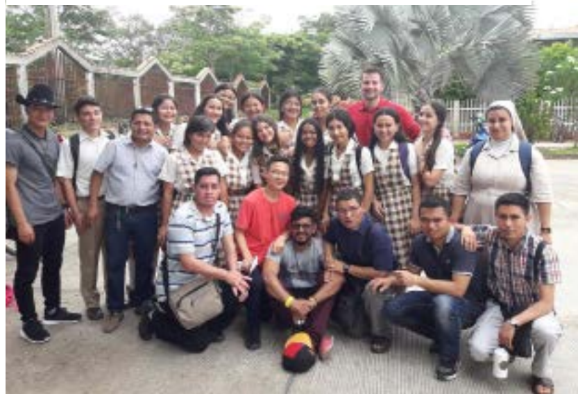
El grupo misionero acompañado de estudiantes del lugar

“estos venezolanos...” y atención, podríamos decir, estos colombianos retornados..., por ser un porcentaje bastante mayor. Entonces, siendo que muchos de los colombianos retornados de Venezuela son ciudadanos colombianos, ¿Por qué el Estado colombiano no responde a los derechos de esa población retornada?