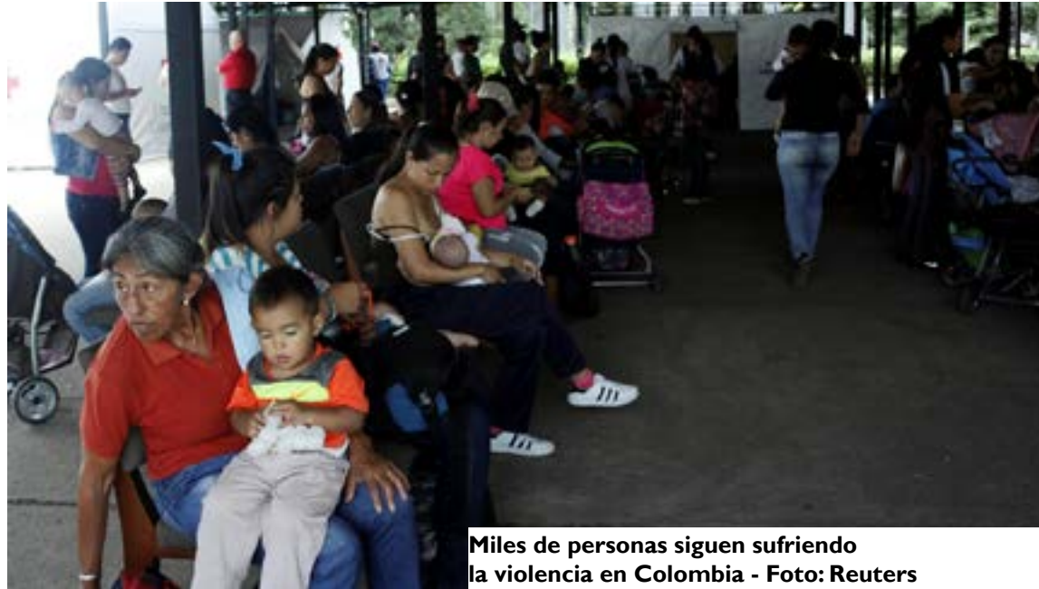
Miles de personas siguen sufriendo la violencia en Colombia

“Al menos 16.000 personas han sido desplazadas por enfrentamientos entre rebeldes del ELN y un reducto de una guerrilla maoísta en la frontera entre Colombia y Venezuela, según la oficina de la ONU para Asuntos Humanitarios (OCHA).