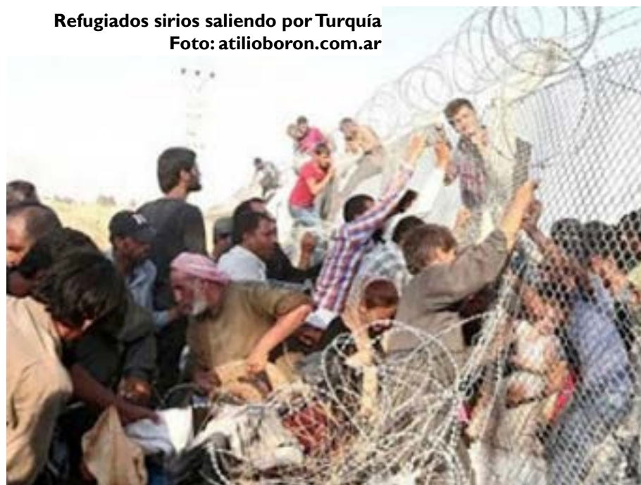
Refugiados sirios saliendo por Turquía