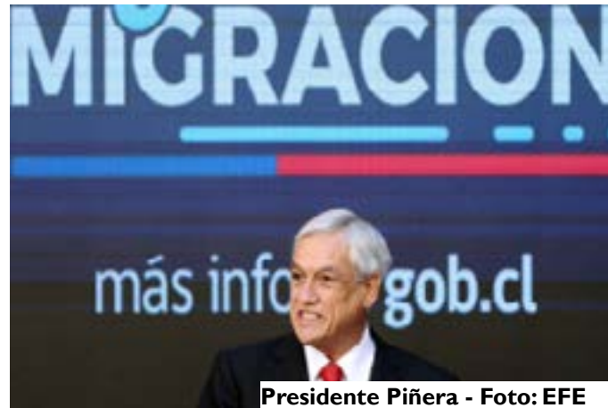
Presidente Piñera

A fines de 2015, se inició el programa ‘Chile Reconoce’, para localizar a quienes estaban en esa situación. Para esto reunieron fuerzas el Gobierno, organizaciones civiles, clínicas jurídicas de universidades y el Alto Comisionado de las Naciones Unidas para los Refugiados (Acnur).