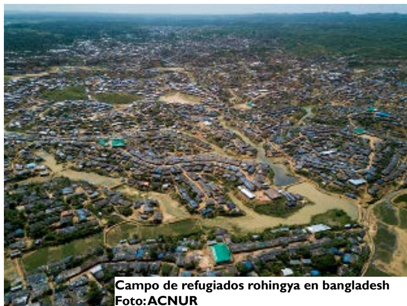
Campo de refugiados rohingya em bangladesh

Se os séculos XVII, XVIII e XIX foram classificados, respectivamente, como Era da Razão, Era das Luzes e Era das Revoluções, o sociólogo polonês Zygmunt Bauman propõe para o século XX a denominação de Era dos Campos de concentração. Refere-se particularmente às máquinas de extermínio dos regimes totalitários de Hitler, como Auschwitz; e de Stalin, como Gulag (Cfr Bauman, Zygmunt. La vie en Miettes , expérience postmoderne e moralité, Ed. Pluriel, Paris, 2014, pag. 178-182). É por demais conhecido e notório como milhões de pessoas perderam a vida nessas antecâmaras do inferno.