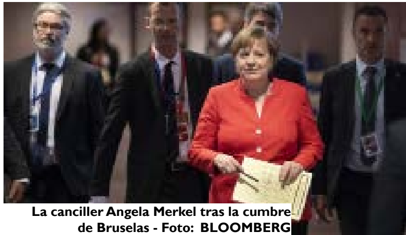
La canciller Angela Merkel tras la cumbre de Bruselas

Se aprobaron medidas que son voluntarias y que ningún país por ahora parece dispuesto a aceptar, como la creación de centros de recepción de migrantes