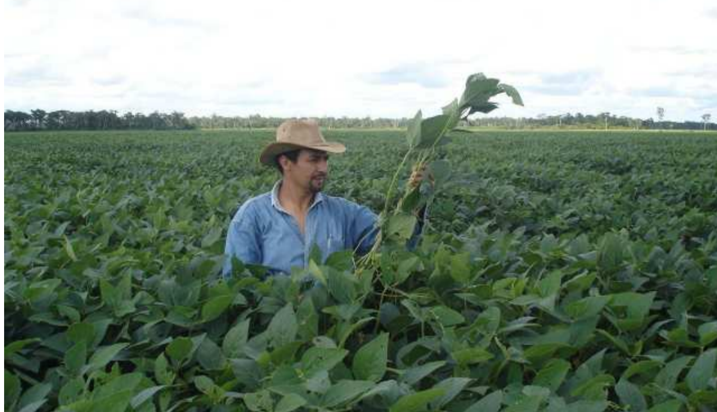
Santa Cruz es el departamento de Bolivia con mayor rendimiento agropecuario, sector en el que trabajan también importantes cantidades de migrantes del occidente del país. En la foto un campo de soya.

Según D. Francisco de Viedma ( Descripción geográfica y estadística de la Provincia de Santa Cruz, 1969 ), "los campos son unas dilatadas campañas de mucha llanura". Fueron conocidos en tiempos de la colonia y hasta hace pocos años como la región de Chiquitos y comprende gran parte del departamento de Santa Cruz. Suscitaban la admiración del gran explorador francés Alcides D'Orbigny que los recorrió en toda su extensión y que los consideraba por sus condiciones naturales aptos para "admitir a la vez todas las ramas de la agricultura, desde la de los países más cálidos hasta las de regiones templadas". "Muchas veces (agrega