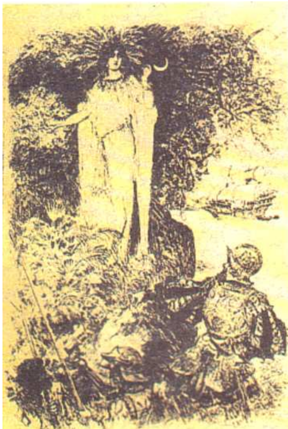
Ilustración de la Leyenda de la Mama Coca, según el libro de Mortimer A History of Coca , Nueva York: Vail JH & Co., 1901

Uno podría continuar ad nauseam sobre el abuso de estas sustancias, porque donde hay hoy en día tráfico de drogas en