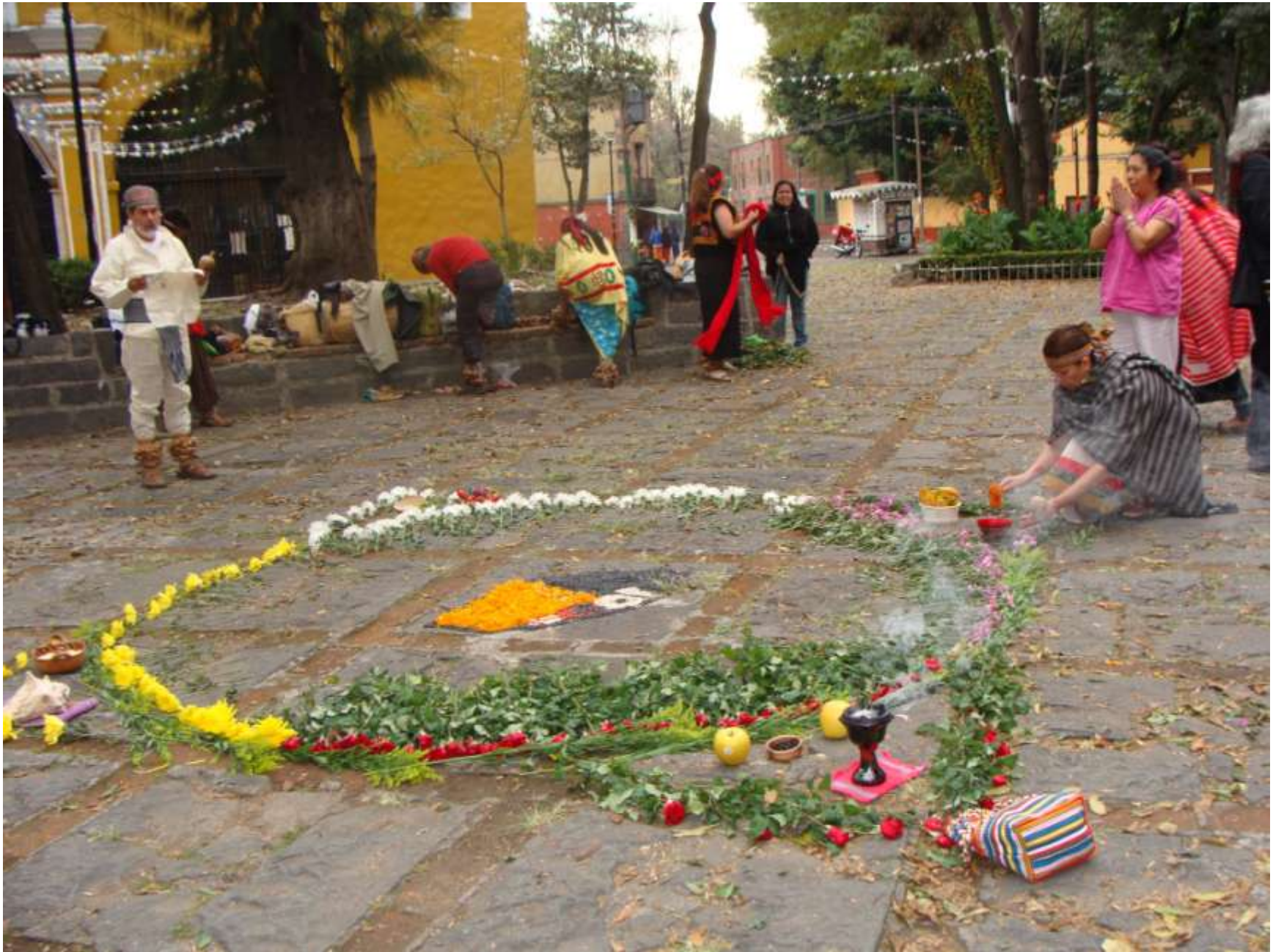
Ceremonia Espiritual de Inicio de los Trabajos del Tribunal, México, DF., Noviembre 3, 2010