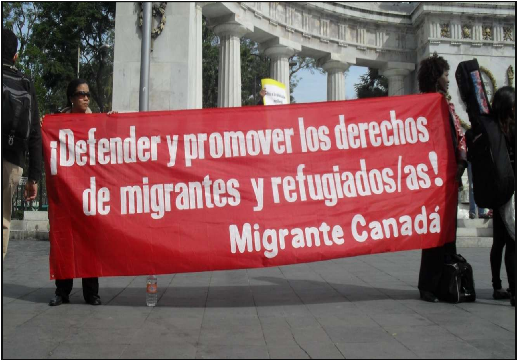
La delegación de Canadá, se prepara para seguir la manifestación hasta llegar a las afueras de la Cámara de los Diputados en San Lázaro.