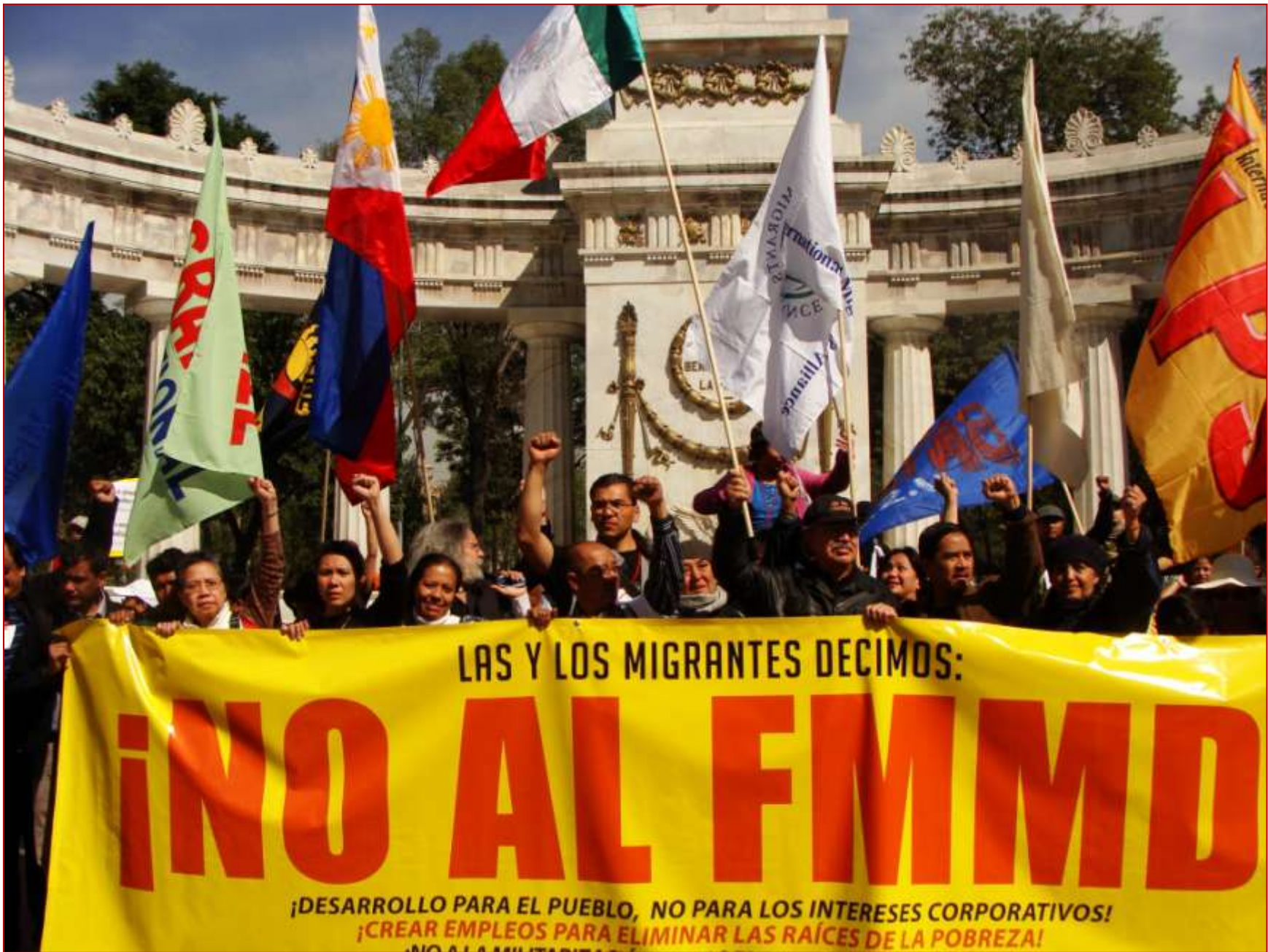
El lunes 8 de noviembre se efectuó una manifestación frente a la Secretaría de Gobernación. Los reclamos expresados fueron: Alto al maltrato de los migrantes en México. Repudio total a las masacres, investigación y juicio a los culpables. Dejen de tratar a los migrantes como mercancías desechables.