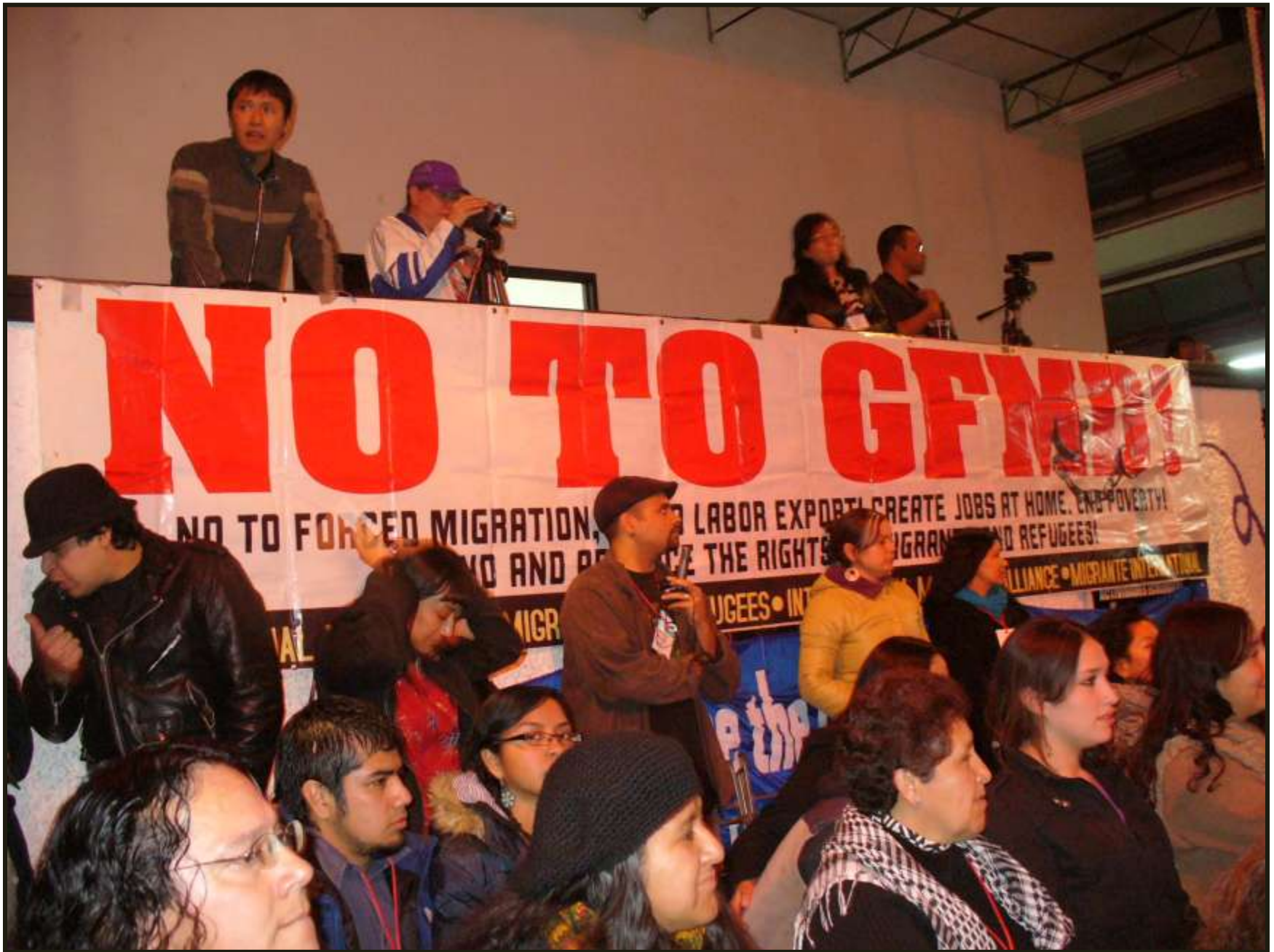
Los talleres de la asamblea fueron pluriétnicos, concurridos y participativos