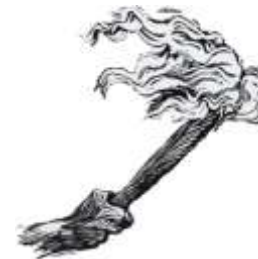
Movimiento Migrante Mesoamericano