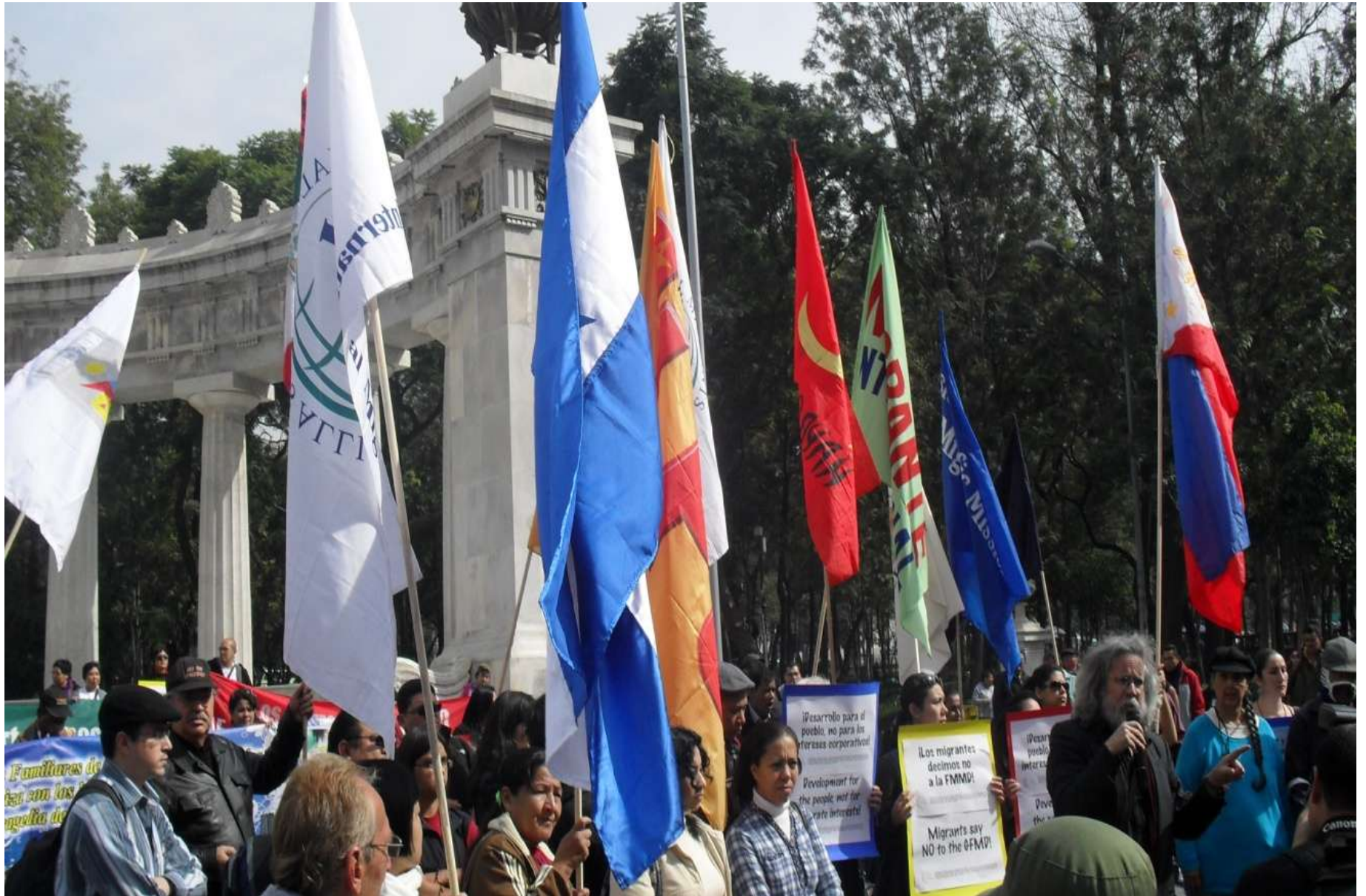
Con sus banderas al aire, después de la SRE, los manifestantes se trasladaron a San Lázaro a unirse al movimiento sindical en San Lázaro para protestar por el proyecto económico que no permite a los pobres salir de la pobreza, donde tomaron la palabra para rechazar los tratados comerciales neoliberales.