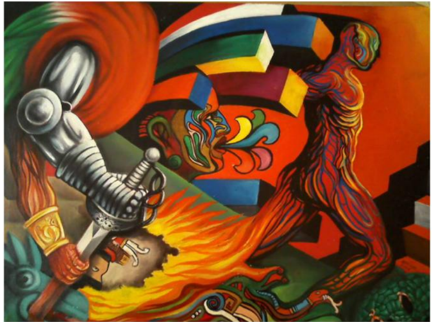
El mestizaje es al mismo tiempo una ideología colonial y un legado objetivo en la dialéctica de la opresión. Ilustración: «El surgimiento del mestizaje y su naturaleza opresora», óleo del pintor mexicano Ehivar Flores Herrera.

Con la elección de Evo Morales como presidente de Bolivia, lo indígena pasa a ser fundamentalmente elemento discursivo del MAS. Es utilizado para evidenciar que, como gobierno, se era diferente a los "tradicionales", como se les dice