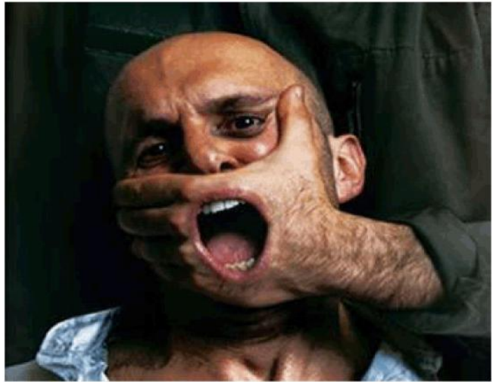
Se puede tapan la boca, pero entonces el grito suele salir más fuerte.

Nosotros estamos convencidos de que la despolitización de la RAE se debe fundamentalmente al miedo electoral que siente la gente de gobierno (ya han perdido a la clase media y más aún al profesional universitario) y al reconocimiento de