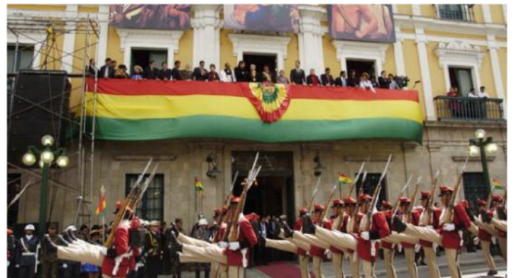
Arriba, la explotación «plurinacional» de los símbolos en el extranjero. Abajo, la prosaica realidad que se vive en Bolivia, donde el simbolismo tiene que agacharse ante los sectores tradicionales de poder, reflejo de la intangibilidad de las «élites» que siempre han gobernado este país.

donde cita una nota comercial de la época: "Se alquila un pongo con taquia" 3 que resume el grado social del kolla en la república. Casos aislados como el de Zarate Wilka en 1899, líder con conciencia política social que intentó negociar la libertad y autodeterminación del pueblo. Fue acribillado por el General Pando al pedir que se hiciese efectivo el trato.