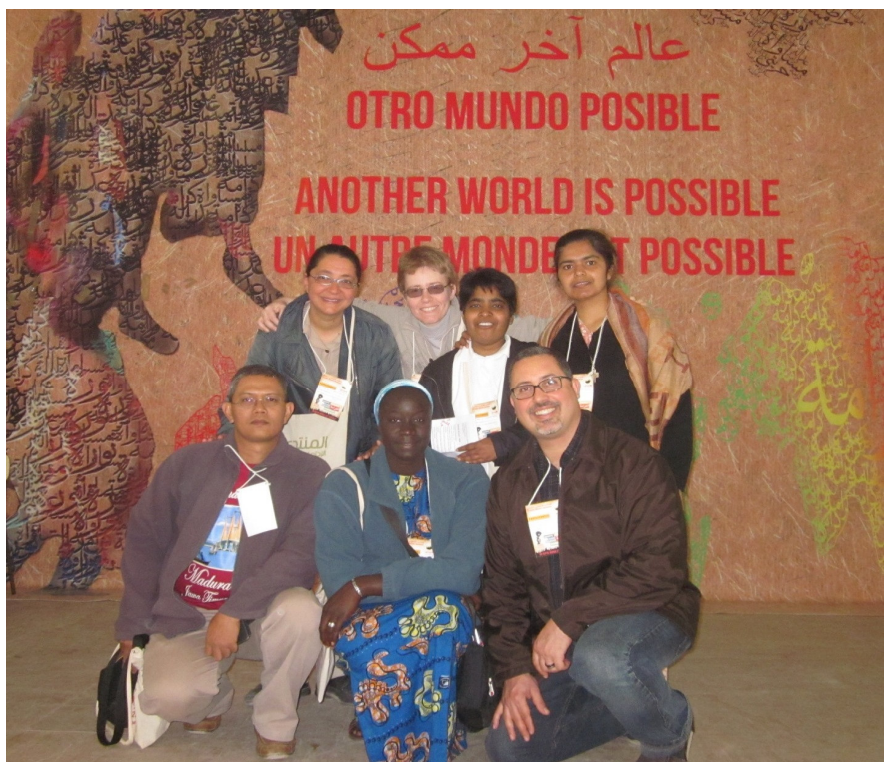
Presencia franciscana en el FSM