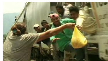
8 de Marzo de 2013